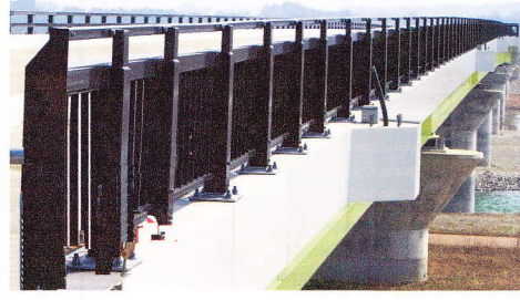
地区内二工事の現況 砺波野大橋に欄干が 取り付けられました